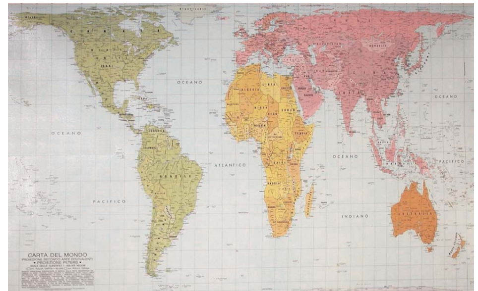
La carta di Peters

Ha il pregio di avere tutte le superfici perfettamente comparabili cioè corrispondenti in proporzione alla realtà. Il suo difetto principale sta nella deformazione verticale delle terre in prossimità dell'Equatore.