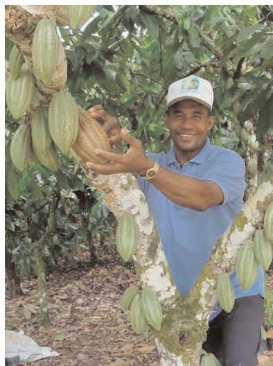
Un produttore del Sud del Mondo di cacao

Trasparenza nella gestione e nelle relazioni commerciali e relazione equa e rispettosa con i propri partner. Ogni organizzazione individua adeguati sistemi di partecipazione per coinvolgere i lavoratori nei processi decisionali e diffondere informazioni a tutti i partner.